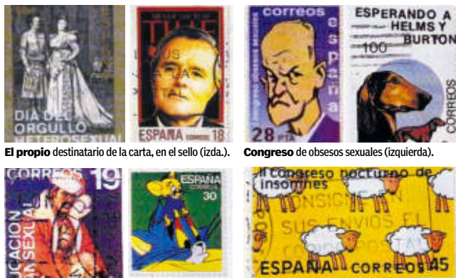
El propio destinatario de la carta, en el sello (izda.).

Dinos... ¿has recibido una carta con este tipo de sellos? CUÉNTANOSLO EN... E-MAIL ● nosevendecartas@20minutos.es WEB ● www.20minutos.es